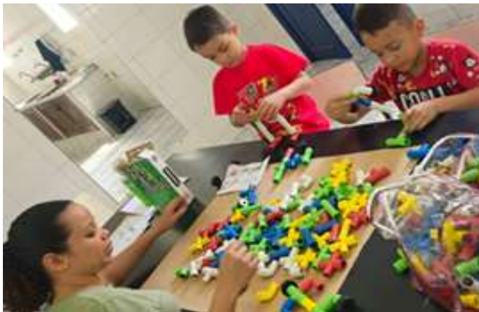
Realização de atividades de pedagogia com jogos de montar

Registrada no CMDCA de Taubaté sob o nº 12013 0076