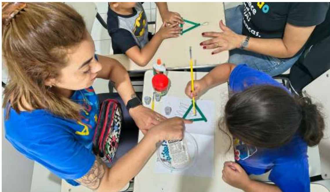
Realização de atividades integradas envolvendo pedagogia e fisioterapia

Registrada no CMDCA de Taubaté sob o nº 12013 0076