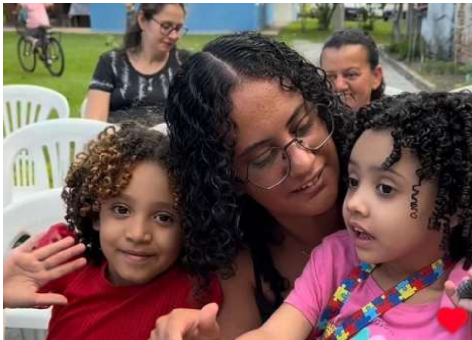
Famílias presentes na tarde de autógrafos