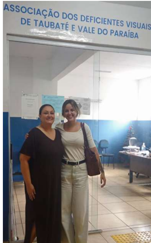
Serviço social e coordenações em reunião do CMAS

Registrada no CMDCA de Taubaté sob o nº 12013 0076