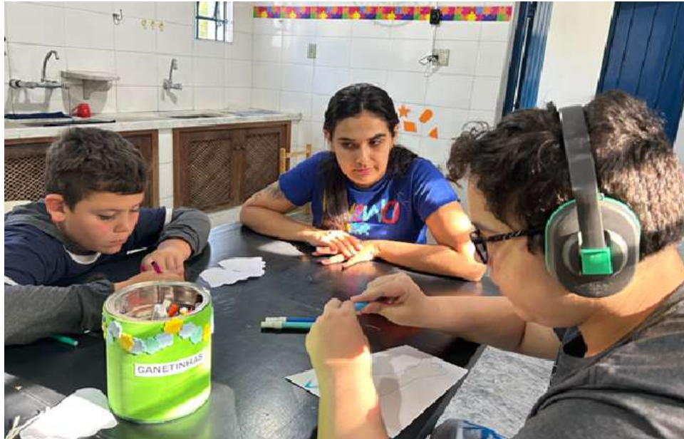
Realização de atividades de pedagogia

Registrada no CMDCA de Taubaté sob o nº 12013 0076