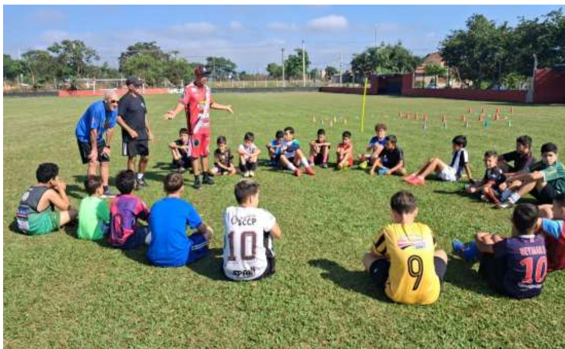
Realização de atividades de esporte