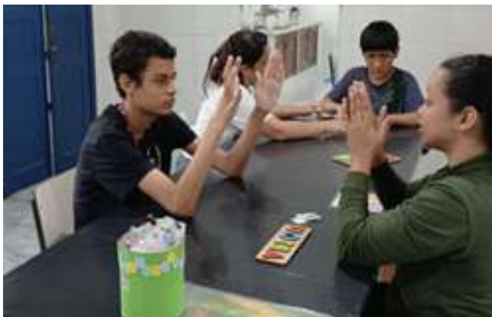
Realização de jogos envolvendo psicopedagogia e psicomotricidade