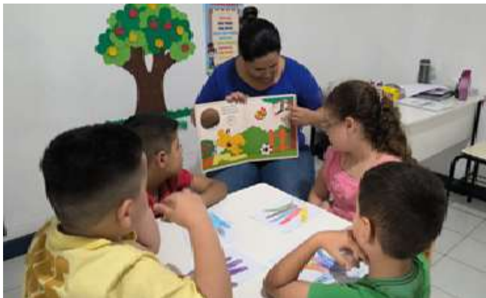
Realização de atividades envolvendo psicologia