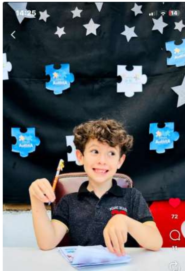
Expressão de alegria de criança na tarde de autógrafos

Registrada no CMDCA de Taubaté sob o nº 12013 0076