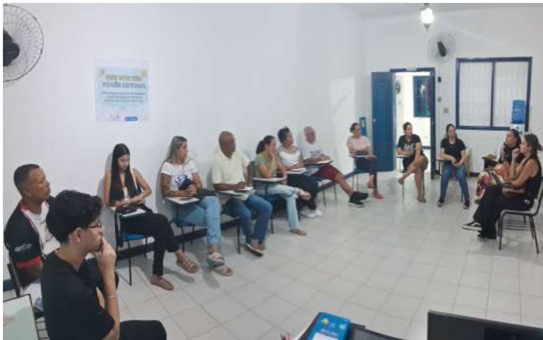
Reunião da equipe técnica e administrativa do projeto

Registrada no CMDCA de Taubaté sob o nº 12013 0076