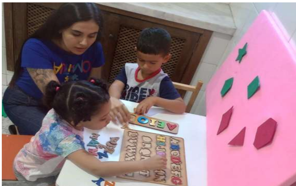
Realização de atividades integradas envolvendo pedagogia e fisioterapia