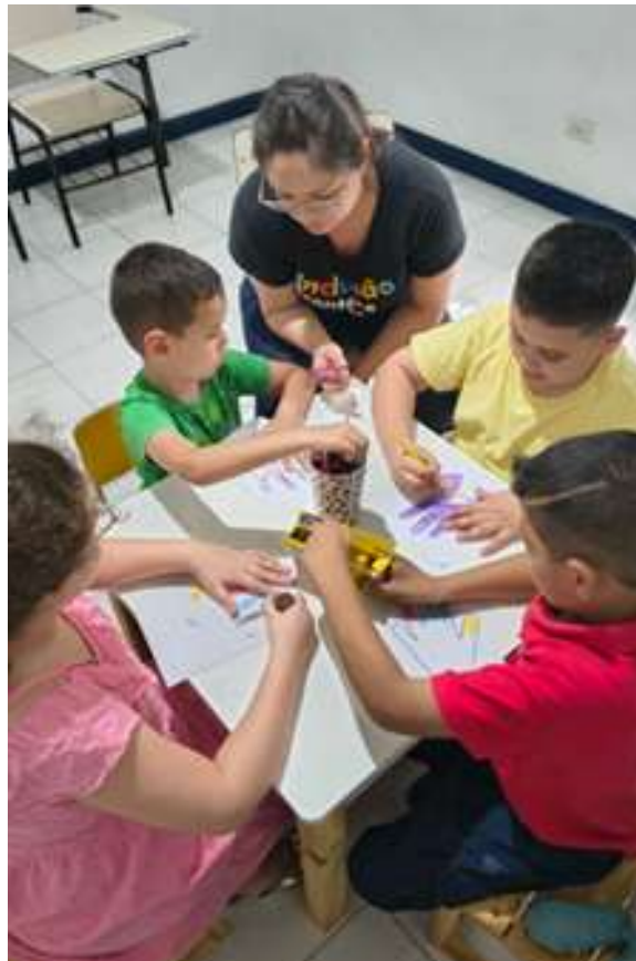
Realização de atividades pedagógicas coletivas com ênfase no cumprimento de regras sociais