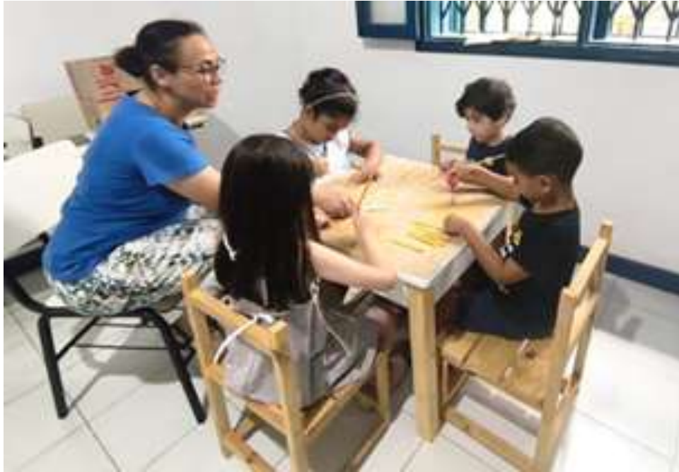
Realização de atividades envolvendo psicologia

Registrada no CMDCA de Taubaté sob o nº 12013 0076