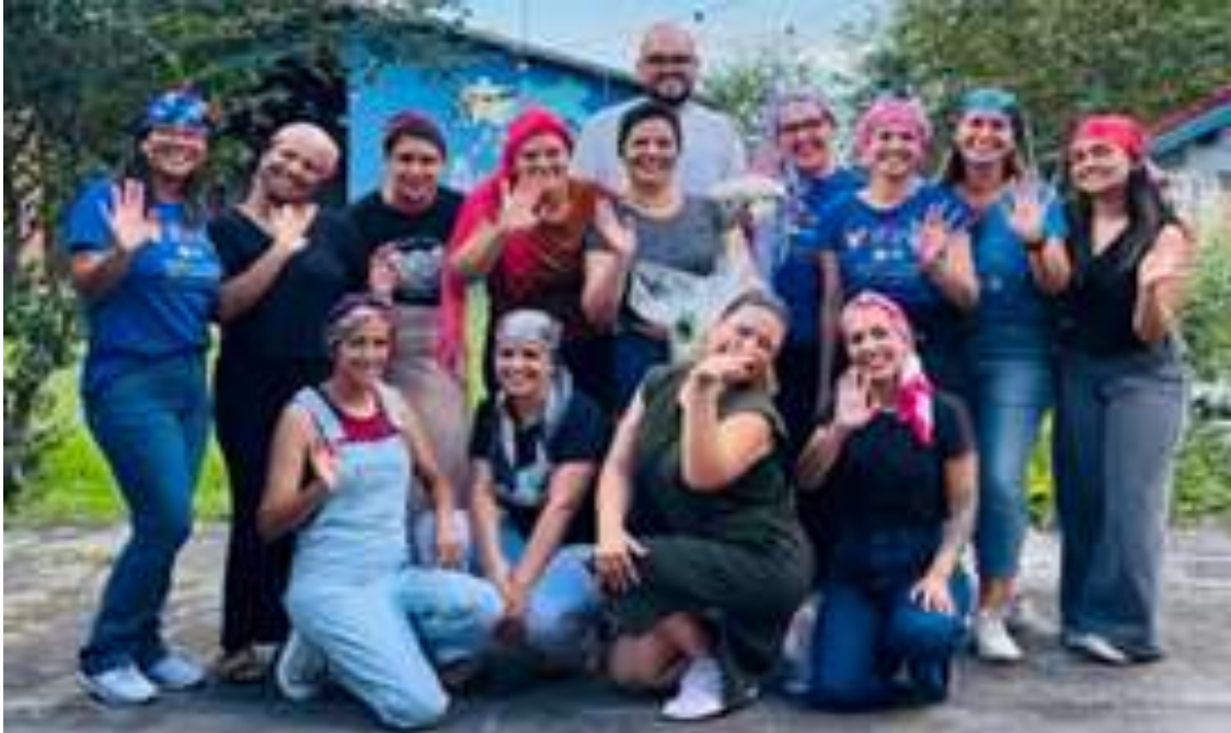
Tarde de maquiagem em apoio à mãe de uma criança com TEA que está em tratamento de câncer

Registrada no CMDCA de Taubaté sob o nº 12013 0076