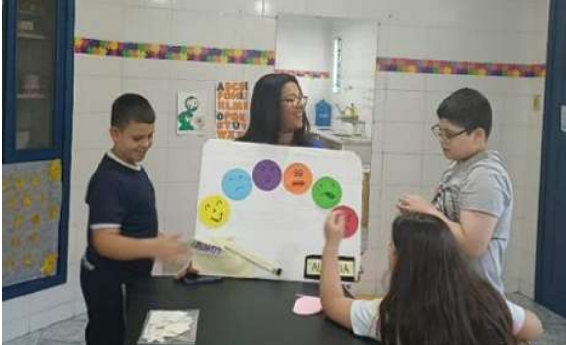
Atividades pedagógicas envolvendo as cores das emoções

Registrada no CMDCA de Taubaté sob o nº 12013 0076