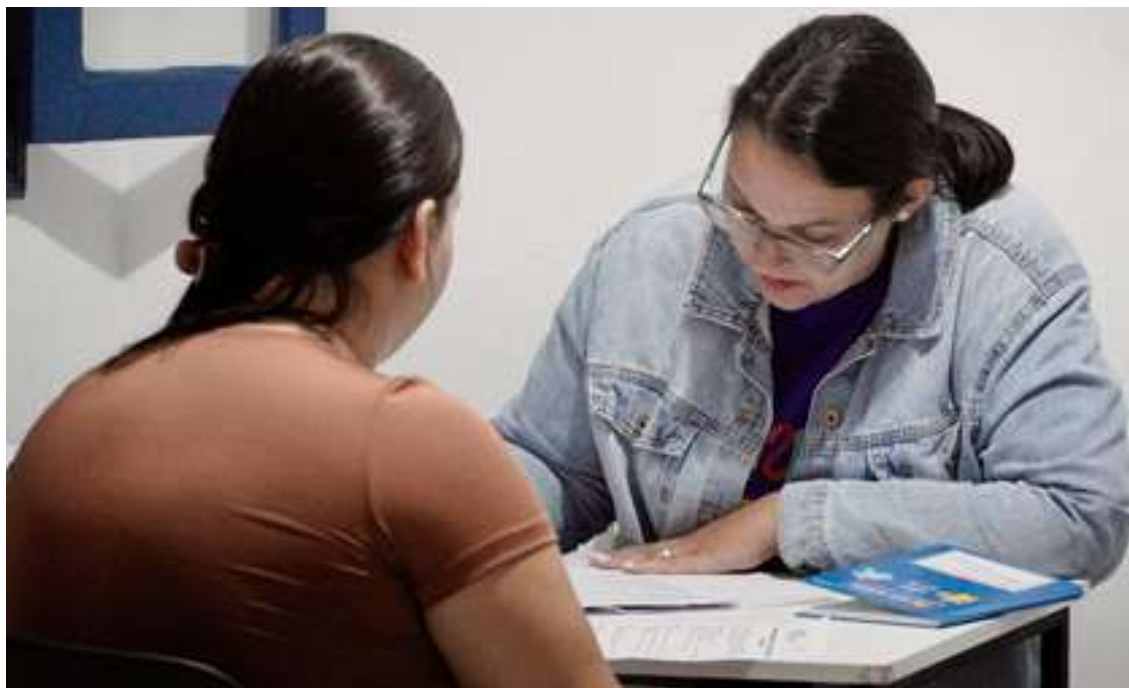
Realização de atendimento do serviço social aos responsáveis pelos atendidos

Registrada no CMDCA de Taubaté sob o nº 12013 0076