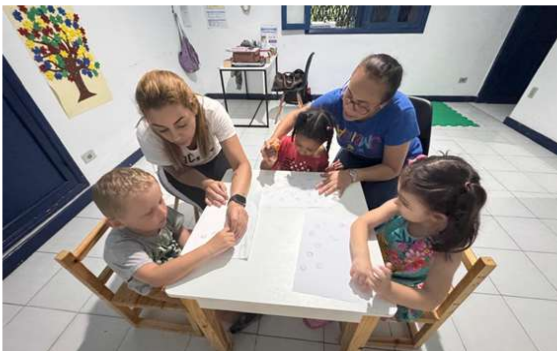
Atividades interdisciplinares envolvendo psicologia e fisioterapia com atividades motoras coletivas