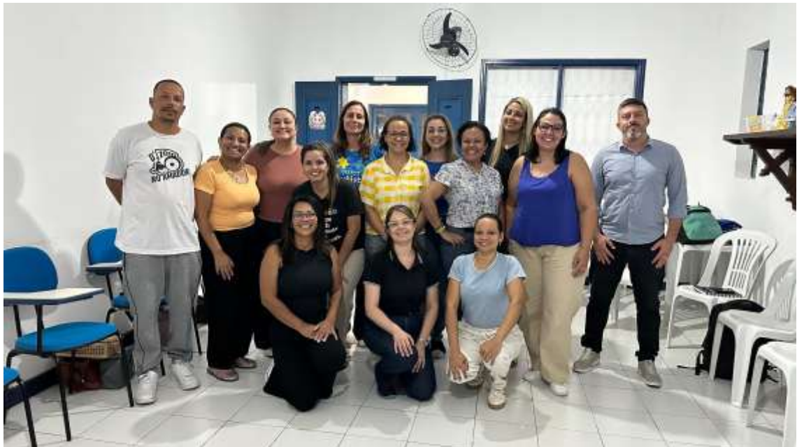
Reunião mensal de alinhamento técnico e administrativo com a equipe do projeto