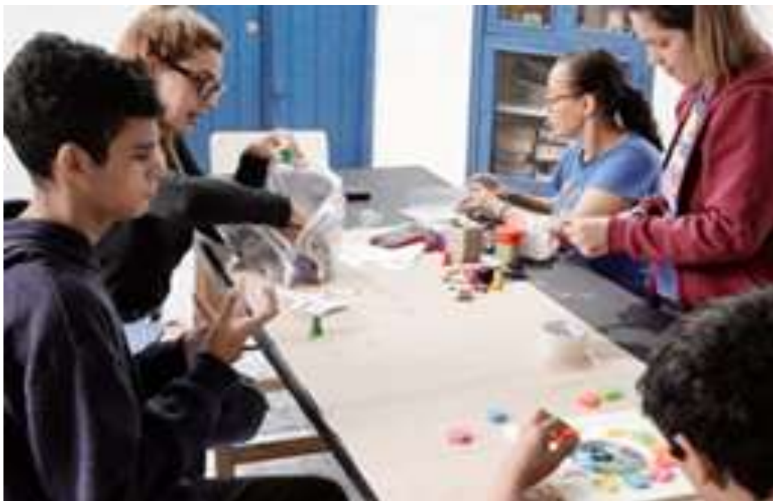
Atividades pedagógicas envolvendo jogos coletivos de alfabetização

Registrada no CMDCA de Taubaté sob o nº 12013 0076