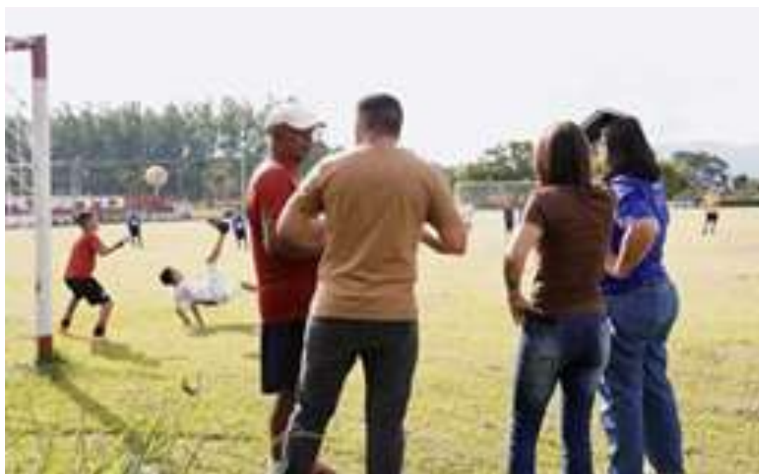
Realização de orientações gerais das coordenações durante as atividades de esporte (destaque para o registro do momento exato do gol de bicicleta do adolescente ao fundo)