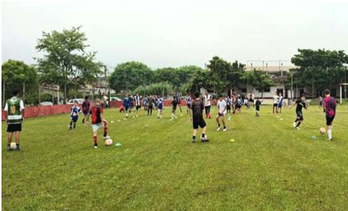
Realização de treino físico durante as atividades de esporte