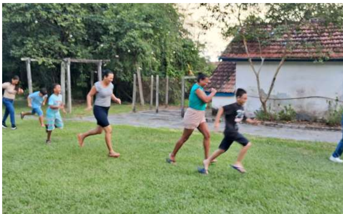
Registro de brincadeira de "apostar corrida" entre crianças e mães na saída do projeto