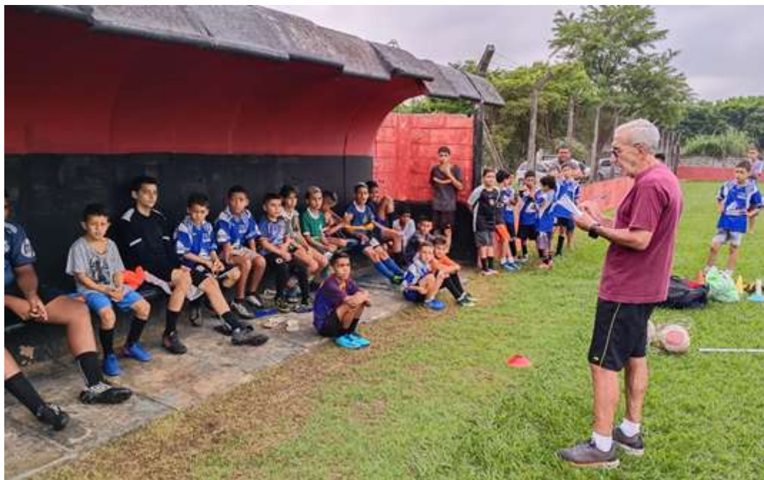
Realização de orientações gerais durante as atividades de esporte

Registrada no CMDCA de Taubaté sob o nº 12013 0076