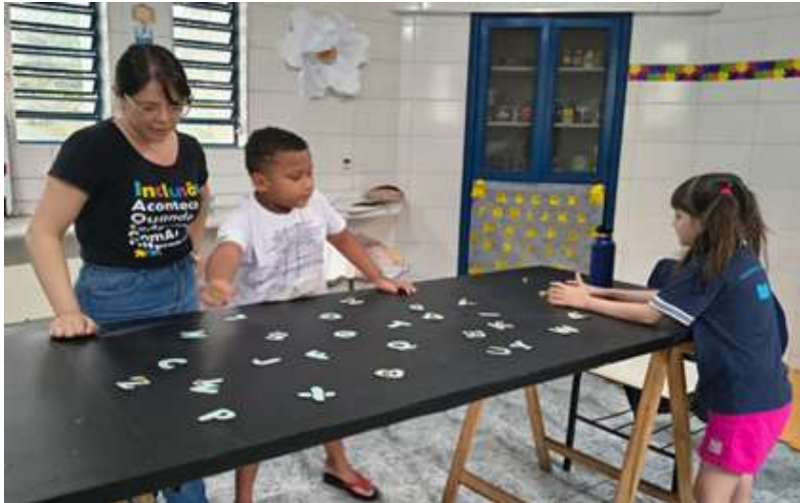
Atividades pedagógicas envolvendo jogos coletivos de alfabetização