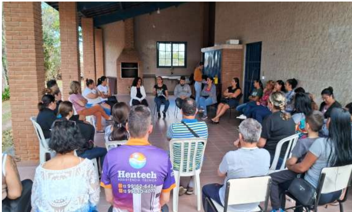
Encontro com as famílias das crianças e adolescentes atendidos

Registrada no CMDCA de Taubaté sob o nº 12013 0076