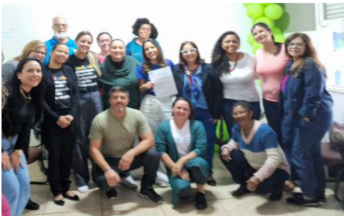
Participação em reunião no Conselho Municipal de Assistência Social