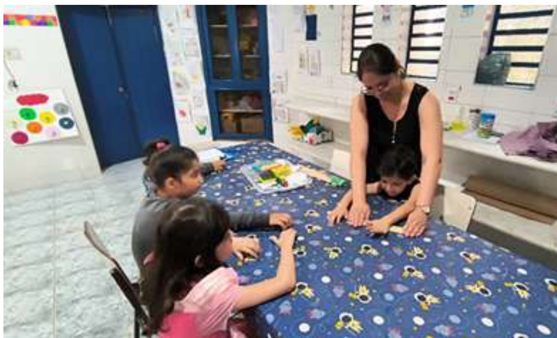
Atividades coletivas com ações sensoriais e habilidades cognitivas