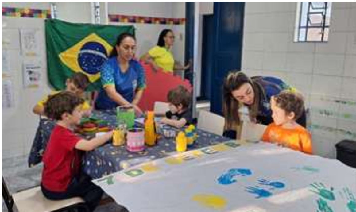
Atividades coletivas com ações sensoriais e habilidades cognitivas