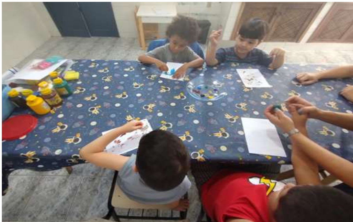
Atividades de psicopedagogia com socialização e estímulo de habilidades cognitivas

Registrada no CMDCA de Taubaté sob o nº 12013 0076