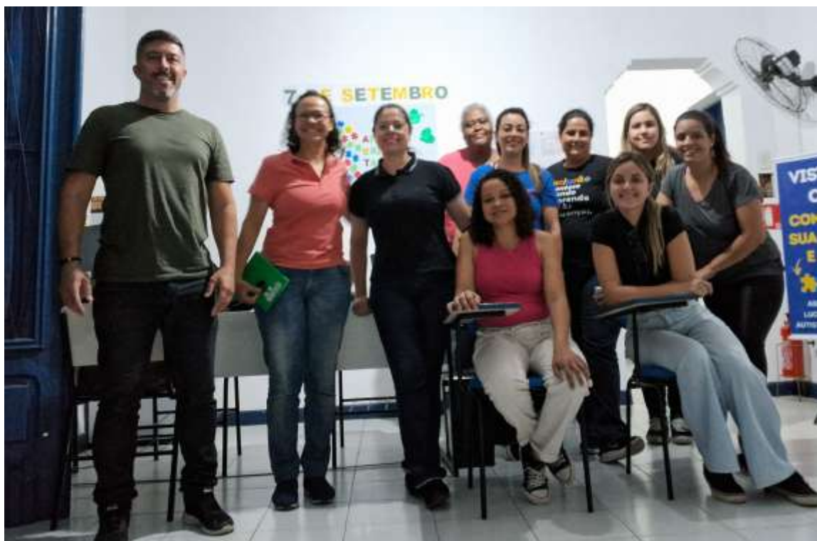
Reunião mensal da equipe do projeto