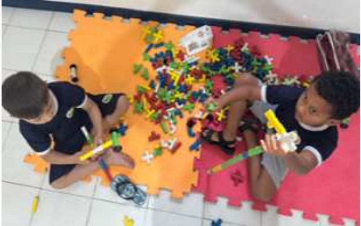
Atividades envolvendo habilidades cognitivas e socialização

Registrada no CMDCA de Taubaté sob o nº 12013 0076