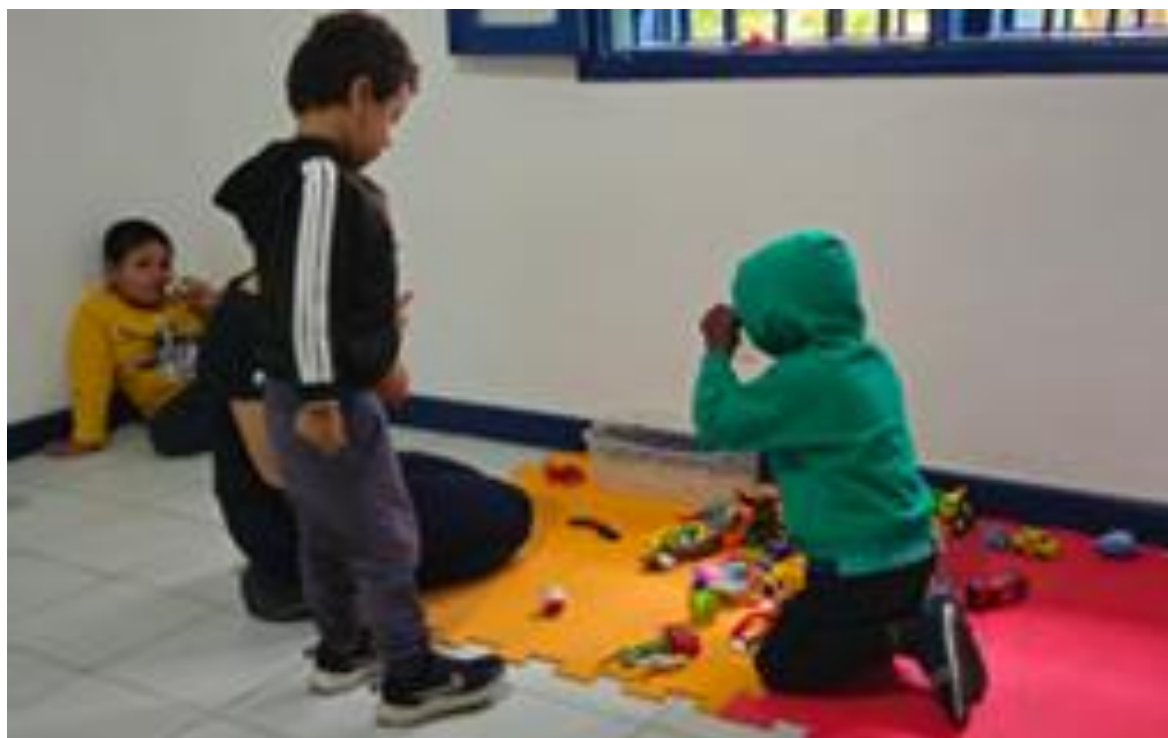
Atividades pedagógicas coletivas