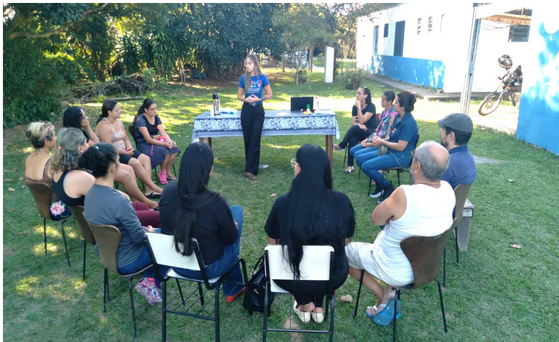
Roda de conversa relacionada à campanha de prevenção ao abuso sexual de crianças e adolescentes

Registrada no CMDCA de Taubaté sob o nº 12013 0076