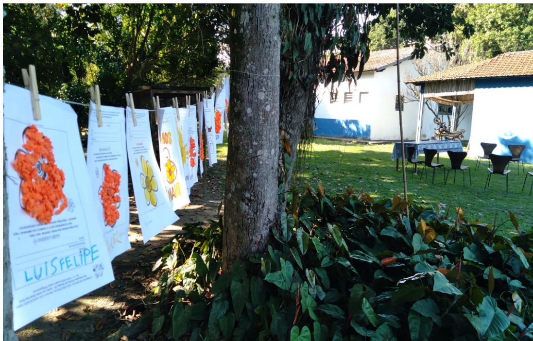
Atividades relacionadas à campanha de prevenção ao abuso sexual de crianças e adolescentes

Registrada no CMDCA de Taubaté sob o nº 12013 0076