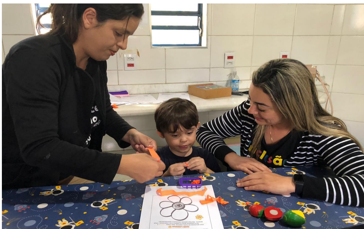
Atividades relacionadas à campanha de prevenção ao abuso sexual de crianças e adolescentes