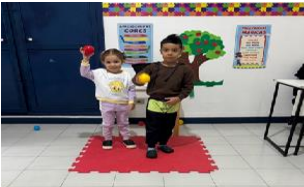
Atividades pedagógicas coletivas envolvendo psicomotricidade

Registrada no CMDCA de Taubaté sob o nº 12013 0076