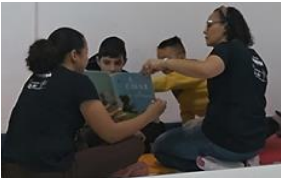
Atividades psicossociais envolvendo concentração e leitura

Registrada no CMDCA de Taubaté sob o nº 12013 0076