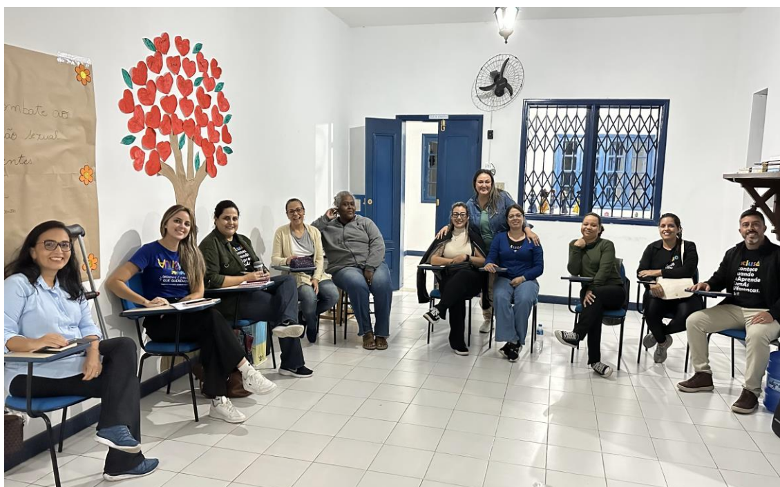
Reunião mensal de alinhamento técnico e administrativo