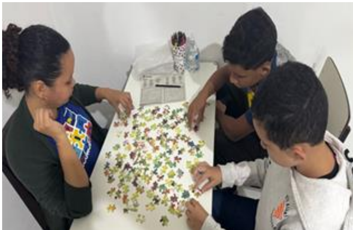
Atividades pedagógicas coletivas envolvendo concentração e habilidades cognitivas