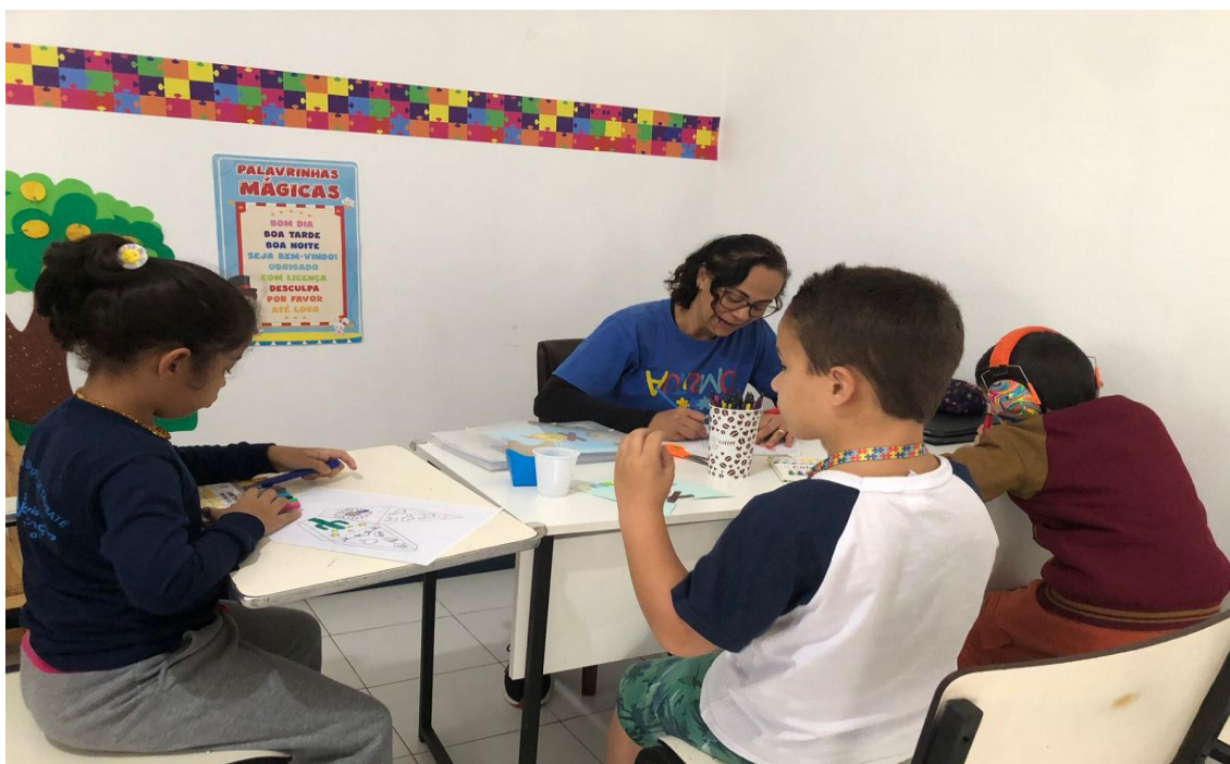
Atividades pedagógicas coletivas envolvendo concentração e habilidades cognitivas