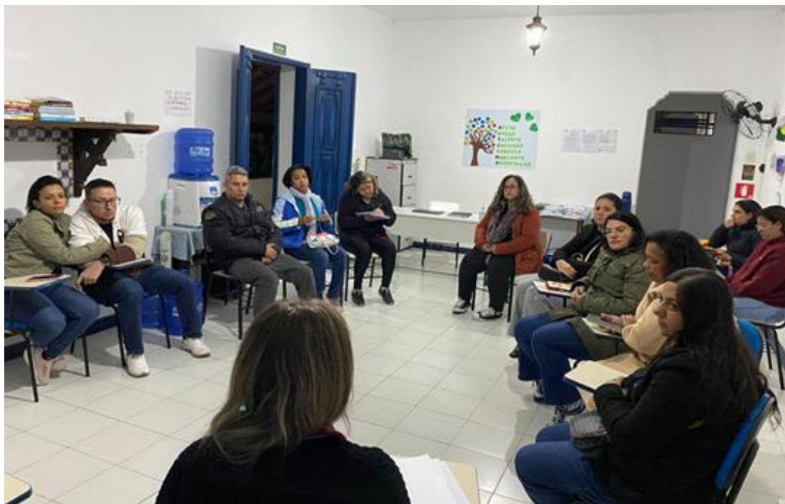
Roda de conversa com pais das crianças e adolescentes atendidos pelo projeto

Registrada no CMDCA de Taubaté sob o nº 12013 0076