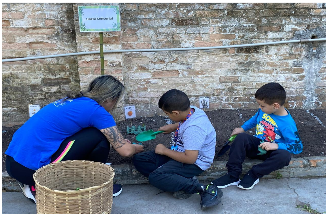
Atividades pedagógicas coletivas