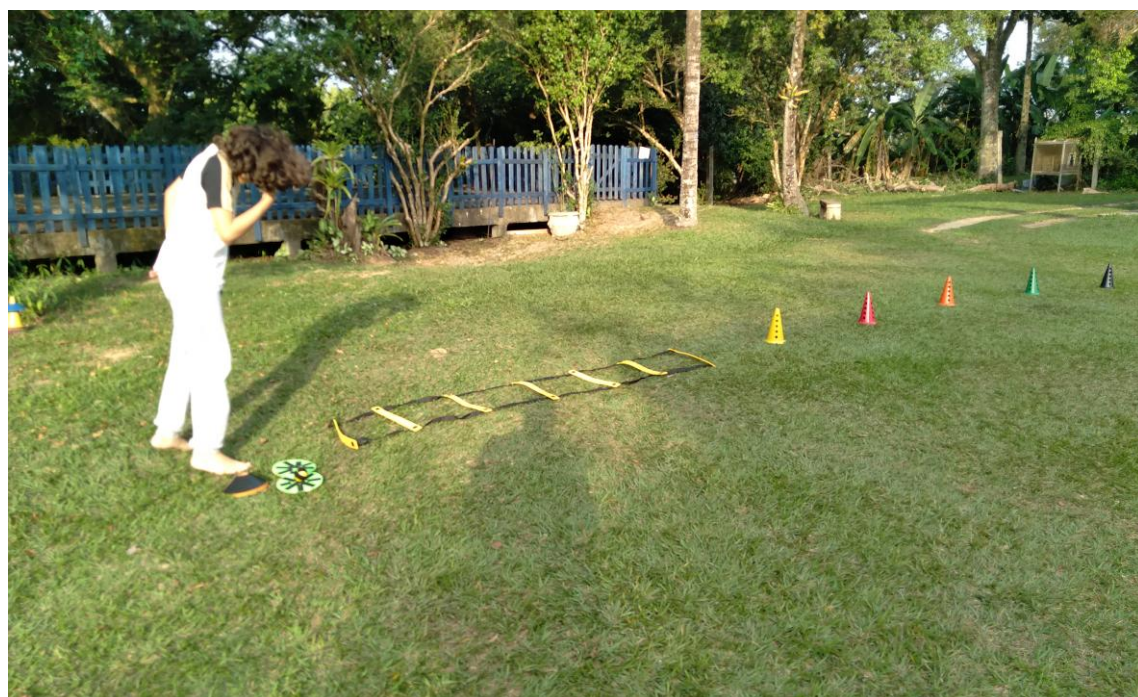
Realização de atividade de dessensibilização e coordenação motora em atendimento de fisioterapia