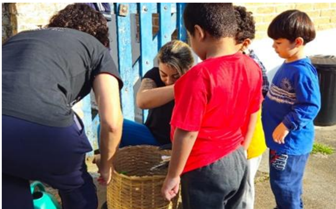
Atividades pedagógicas coletivas envolvendo psicomotricidade

Registrada no CMDCA de Taubaté sob o nº 12013 0076