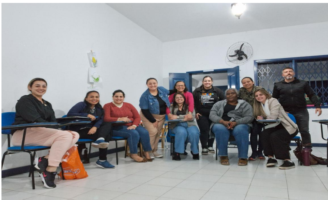
Reunião mensal de alinhamento técnico e administrativo