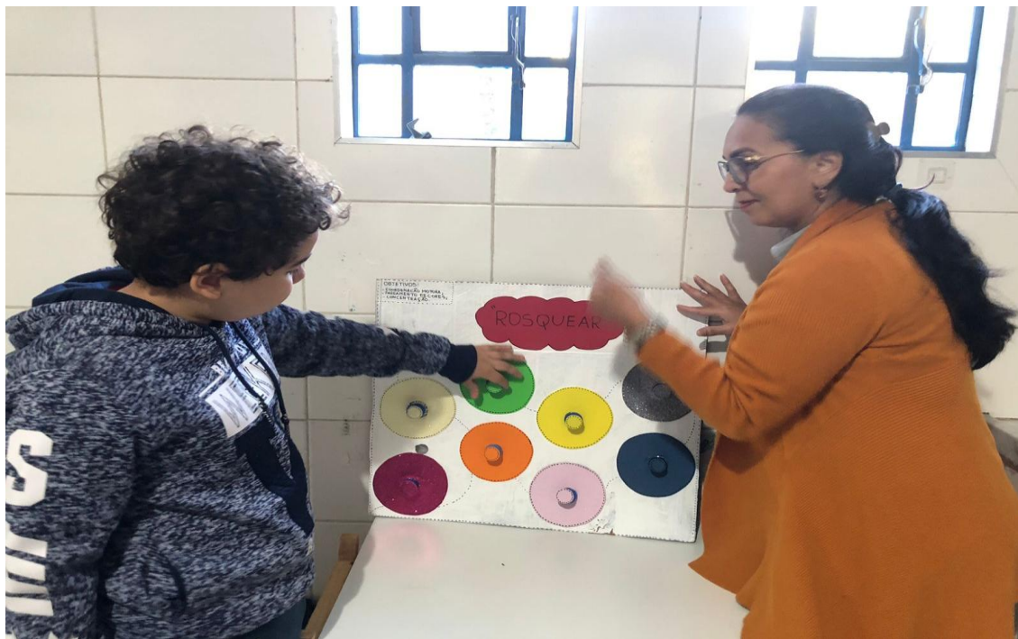
Atividades pedagógicas envolvendo habilidades cognitivas

Registrada no CMDCA de Taubaté sob o nº 12013 0076