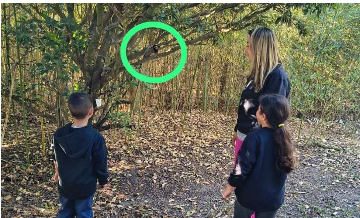
Atividades de interação com a natureza e socialização com a visita de um sagui