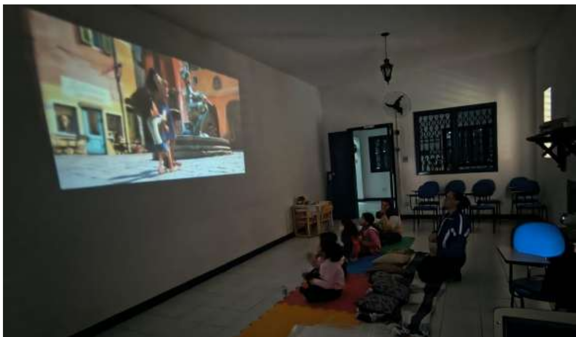
Sessão cine pipoca trabalhando aspectos de tolerância a ambientes escuros