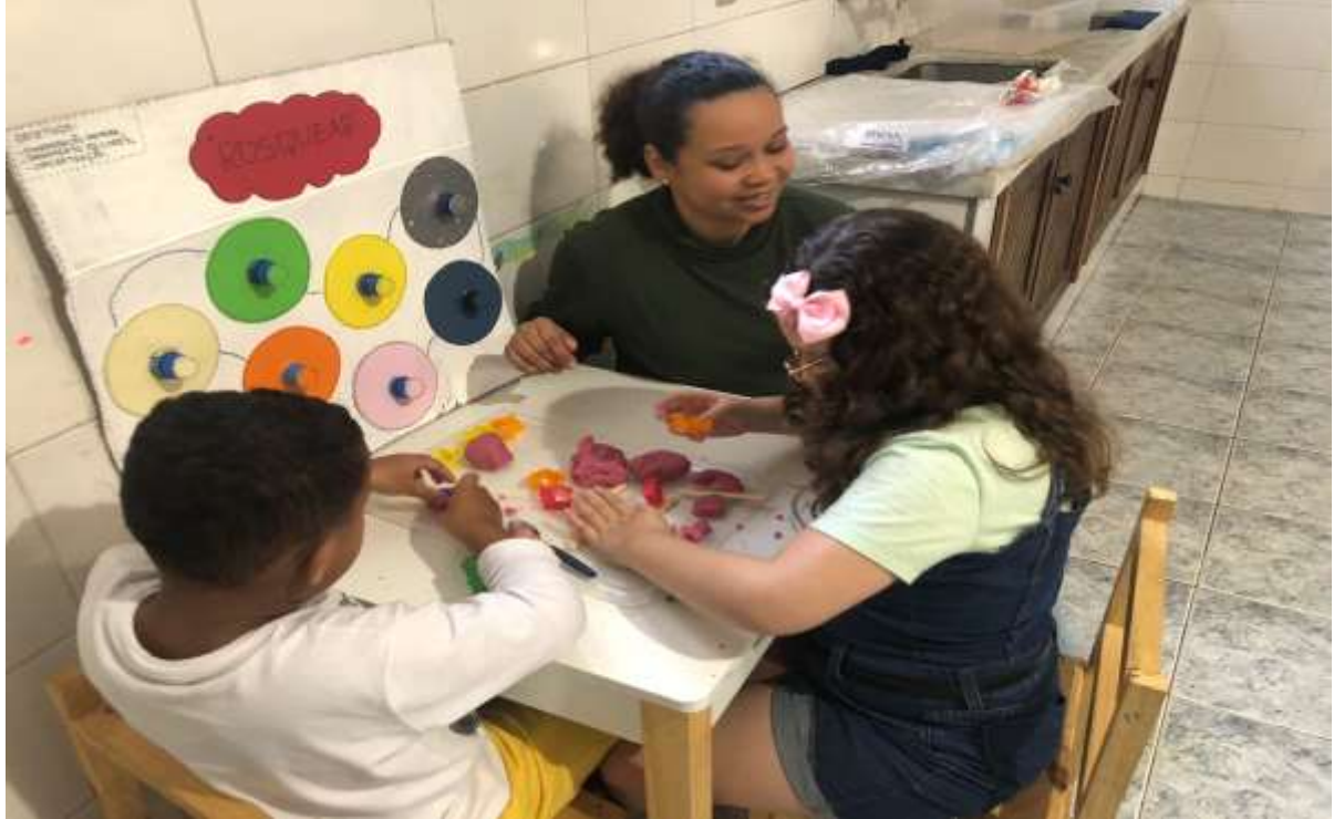
Atividades pedagógicas coletivas envolvendo psicomotricidade

Registrada no CMDCA de Taubaté sob o nº 12013 0076