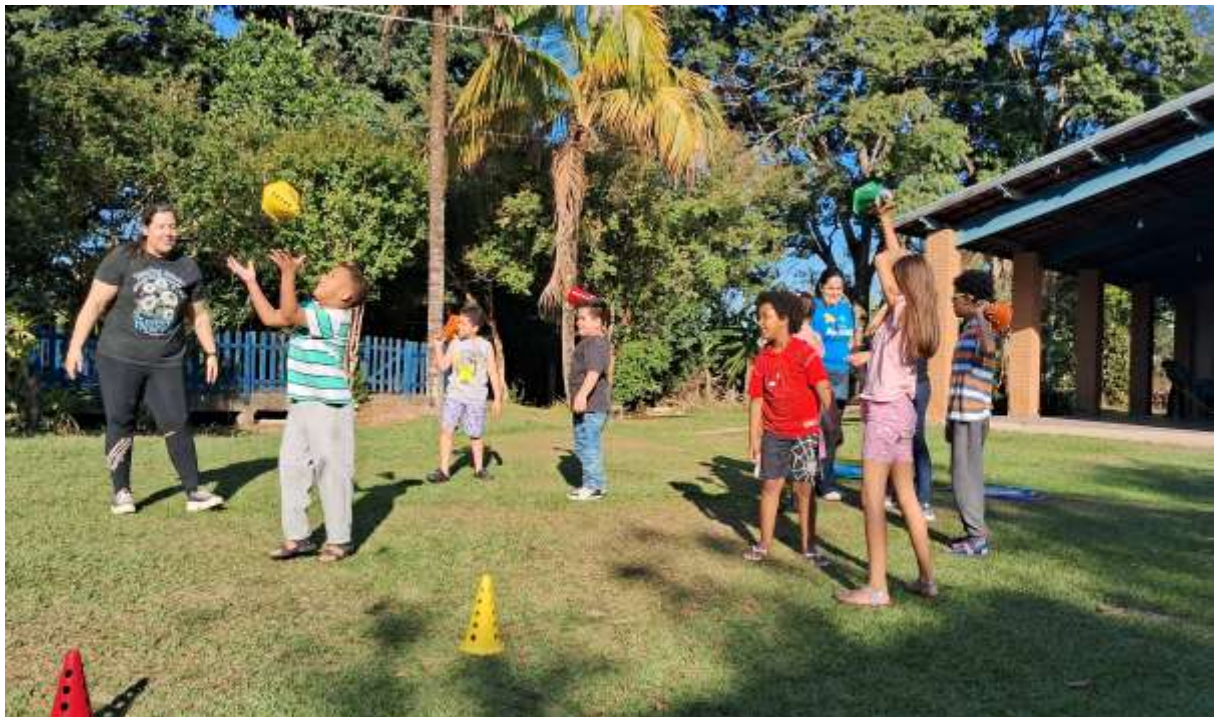
Realização de brincadeiras envolvendo dessensibilização, interação social e coordenação motora