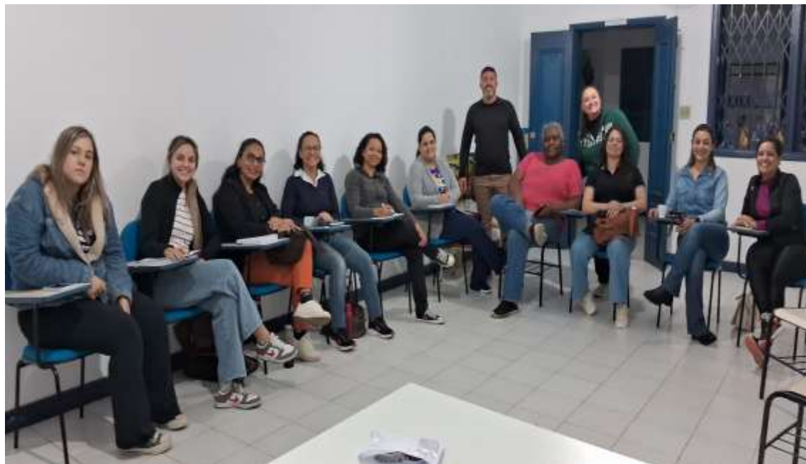
Reunião mensal de alinhamento técnico e administrativo

Registrada no CMDCA de Taubaté sob o nº 12013 0076