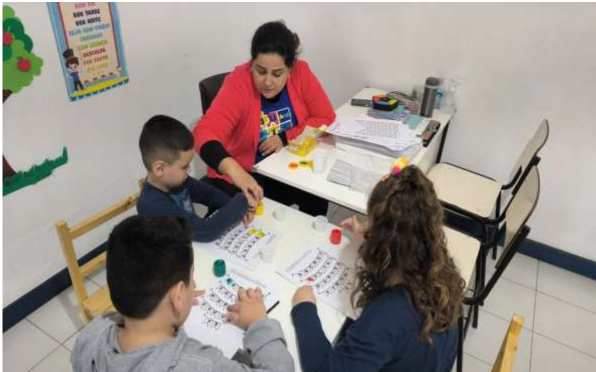
Atividades envolvendo concentração, socialização e habilidades cognitivas