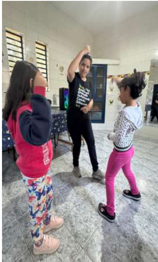
Realização de danças e brincadeiras envolvendo coordenação motora e lateralidade

Registrada no CMDCA de Taubaté sob o nº 12013 0076