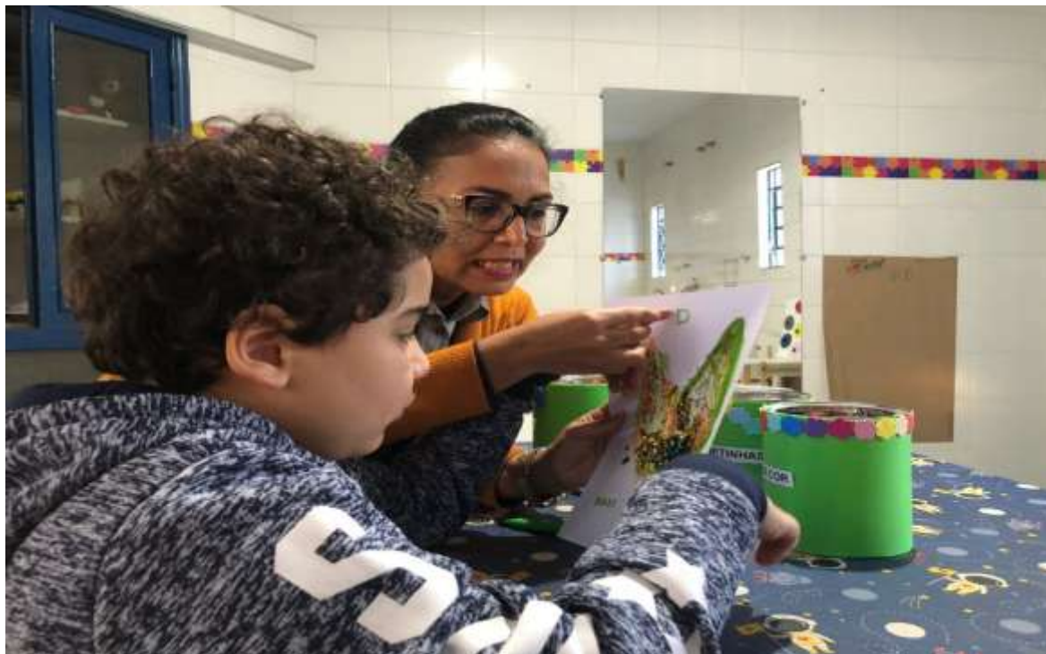
Atividades pedagógicas envolvendo habilidades cognitivas

Registrada no CMDCA de Taubaté sob o nº 12013 0076