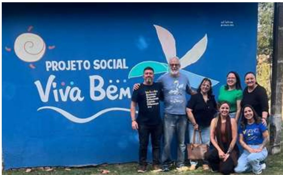
Visita do Conselho Municipal de Assistência Social