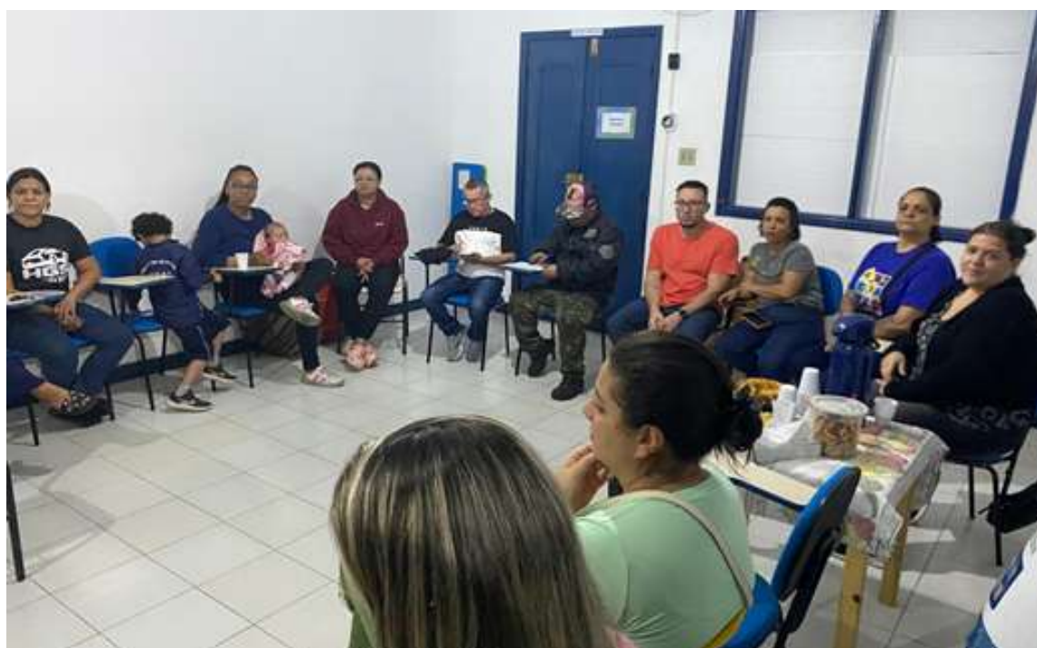
Encontro com as famílias das crianças e adolescentes atendidos pelo projeto