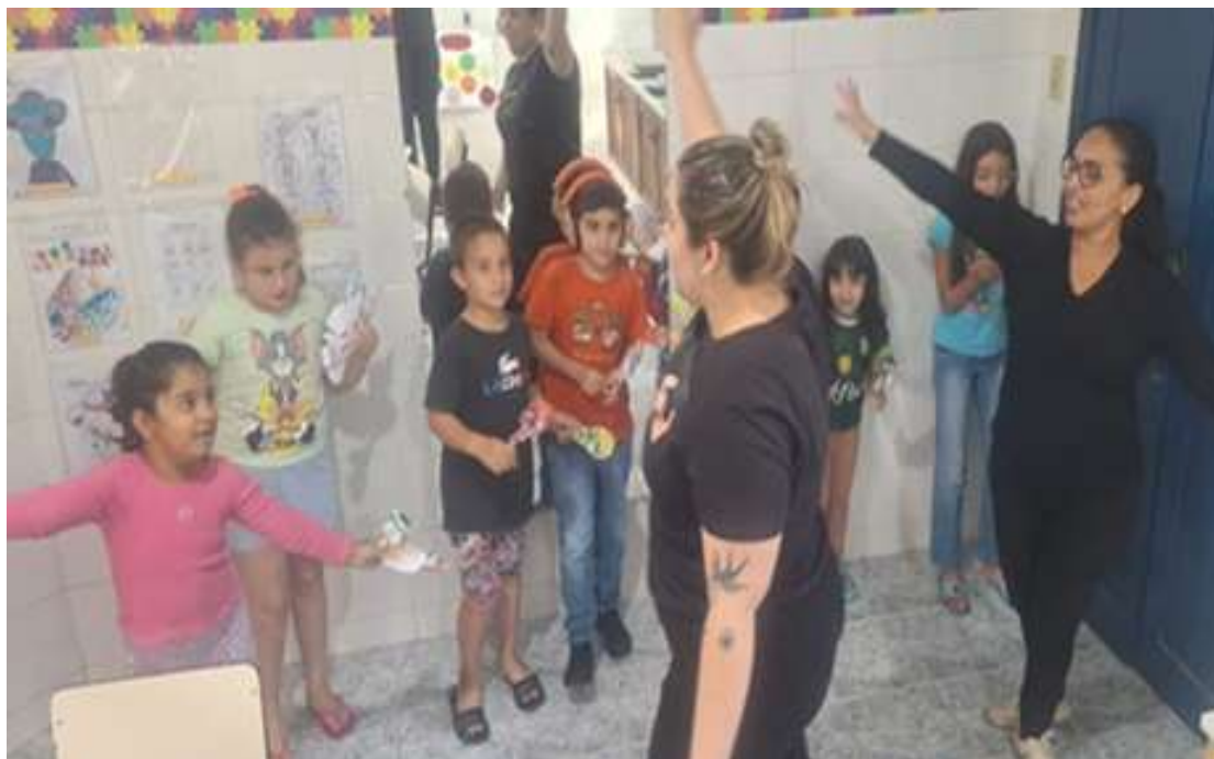
Realização de brincadeiras envolvendo interação social e coordenação motora

Registrada no CMDCA de Taubaté sob o nº 12013 0076