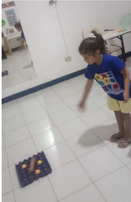
Atividades de fisioterapia com jogos envolvendo psicomotricidade

Registrada no CMDCA de Taubaté sob o nº 12013 0076