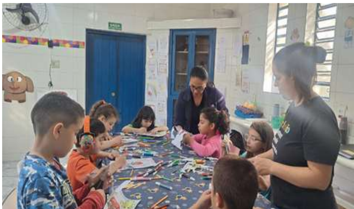
Atividades coletivas envolvendo psicopedagogia