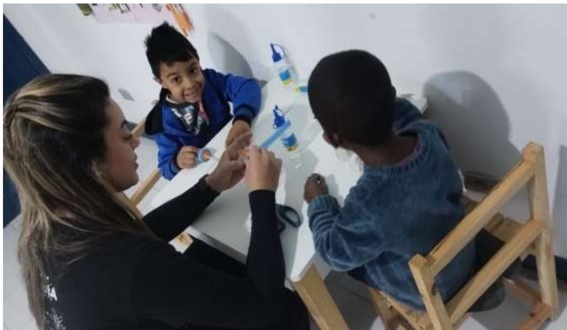
Atividades de dessensibilização coletiva em atividades de fisioterapia

Registrada no CMDCA de Taubaté sob o nº 12013 0076