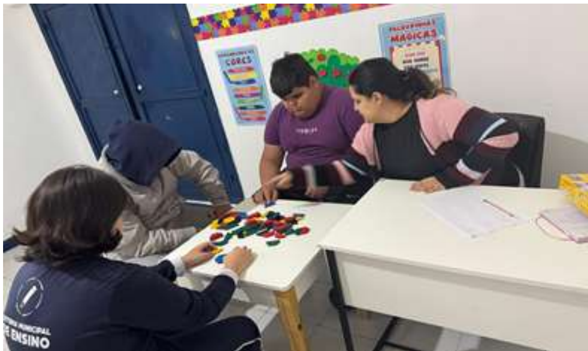
Atividades com jogos envolvendo concentração, socialização e habilidades cognitivas