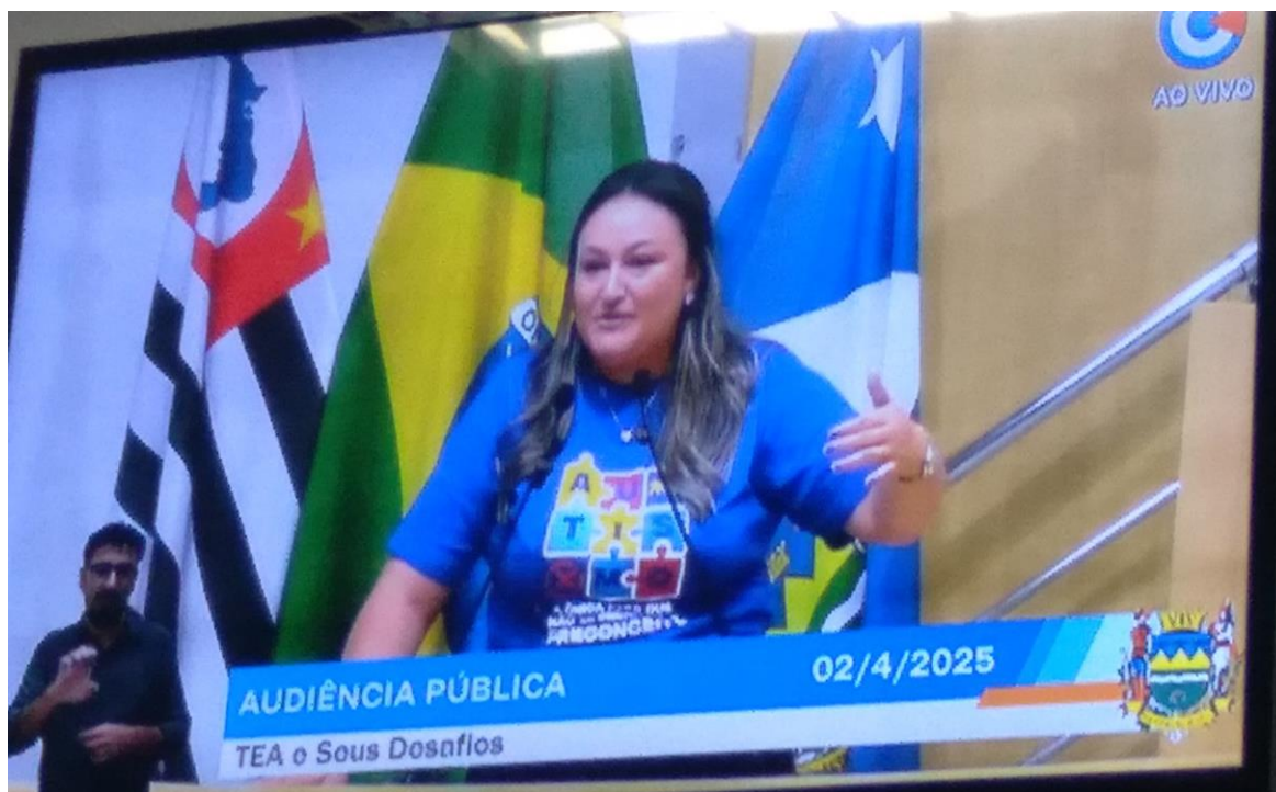
Participação da equipe do projeto na audiência pública no dia mundial da conscientização sobre o autismo