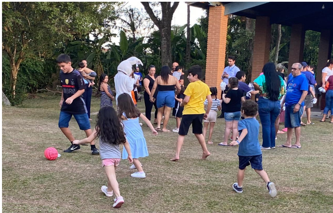
Crianças típicas e neurodivergentes em atividade coletiva promovendo a inclusão social e comunitária

Registrada no CMDCA de Taubaté sob o nº 12013 0076