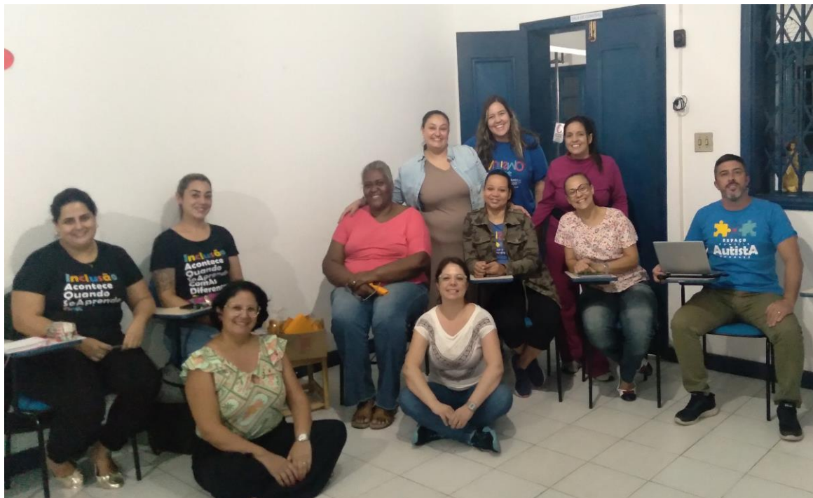
Reunião de alinhamento com a equipe técnica e administrativa do projeto

Registrada no CMDCA de Taubaté sob o nº 12013 0076