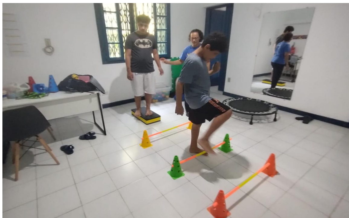
Atendimento coletivo com atividades de psicomotricidade com circuito de fisioterapia