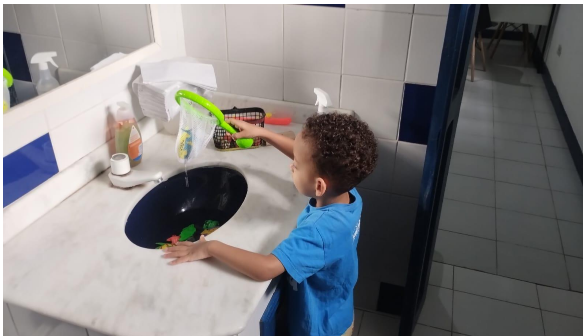
Atendimento de crianças com atividades sensoriais utilizando a pia como lago de pescaria

Registrada no CMDCA de Taubaté sob o nº 12013 0076