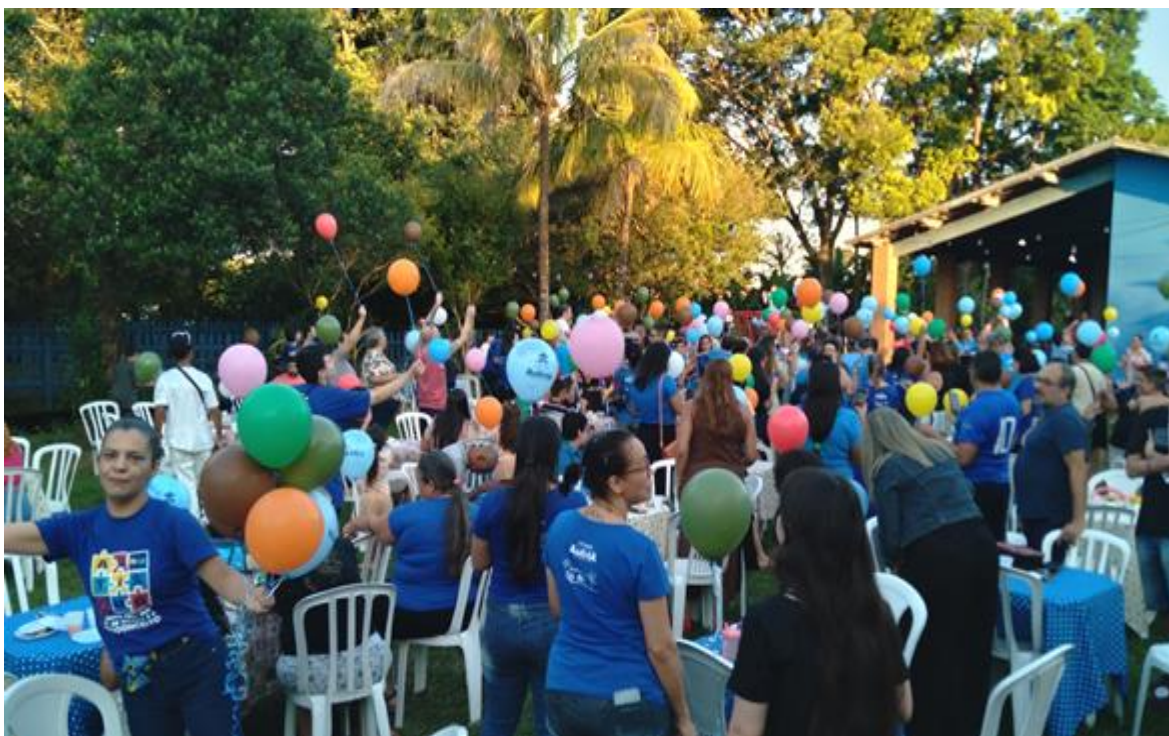
Encontro comemorativo com as famílias das crianças e adolescentes atendidos na sede do projeto